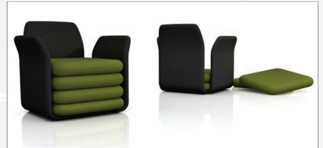
OOCH BBB emmebonacina, 2008