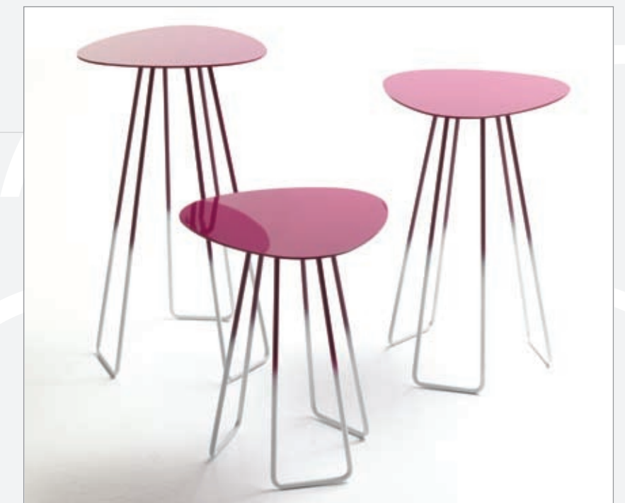
Medusa Gruppo Sintesi, 2008